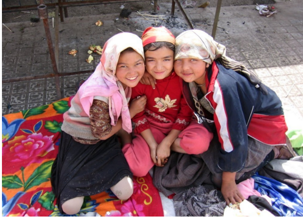
Уйгурски деца.