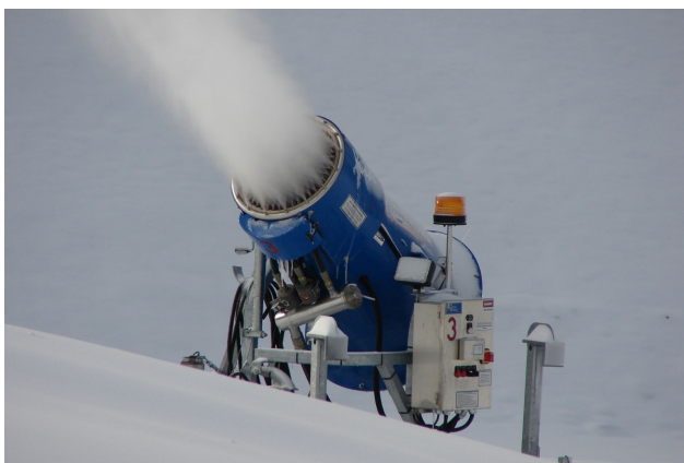
Оръдие за сняг.

Много учени, спортисти и политици казват колко е важно следващите Зимни олимпийски игри да се проведат на по-подходящо място.