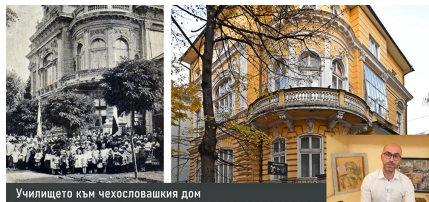
Училището към чехословашкия дом

Само преди няколко дни на страницата Historical Routes Sofia гледахме шести епизод от поредицата „Софийските училища“.