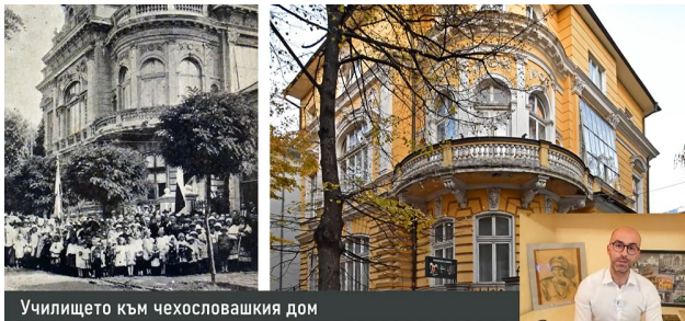
Училището към чехословашкия дом

Само преди няколко дни на страницата Historical Routes Sofia гледахме шести епизод от поредицата „Софийските училища“.